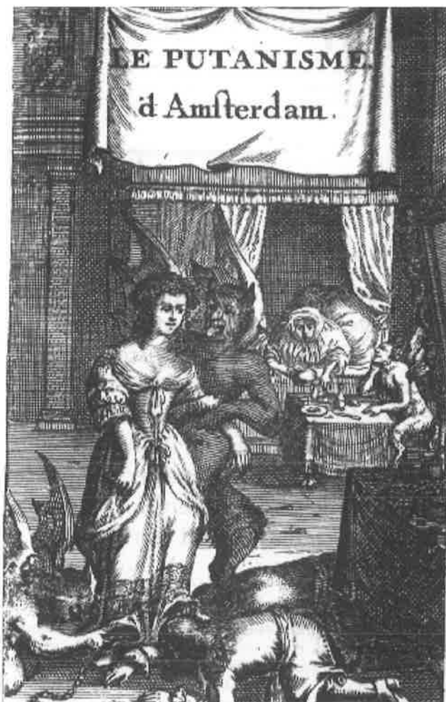
Titelprent van Le Putanisme d'Amsterdam , 1681 (UB Amsterdam)

alleen om reputatie en beeldvorming. Ook in werkelijkheid is de prostitutie in de grote havenstad met haar vele migranten, die Amsterdam toen was, omvangrijk en duidelijk zichtbaar geweest. Het was binnen de stad een middelgrote bedrijfstak, waar veel geld in omging, waar duizend tot 1500 mensen van leefden en vele anderen een graantje van meepikten. In de geschiedschrijving is er over dit alles echter vrijwel niets te vinden. Hoeren en bordelen pasten blijkbaar niet in het beeld van Amsterdam in zijn meest bejubelde en gouden periode.