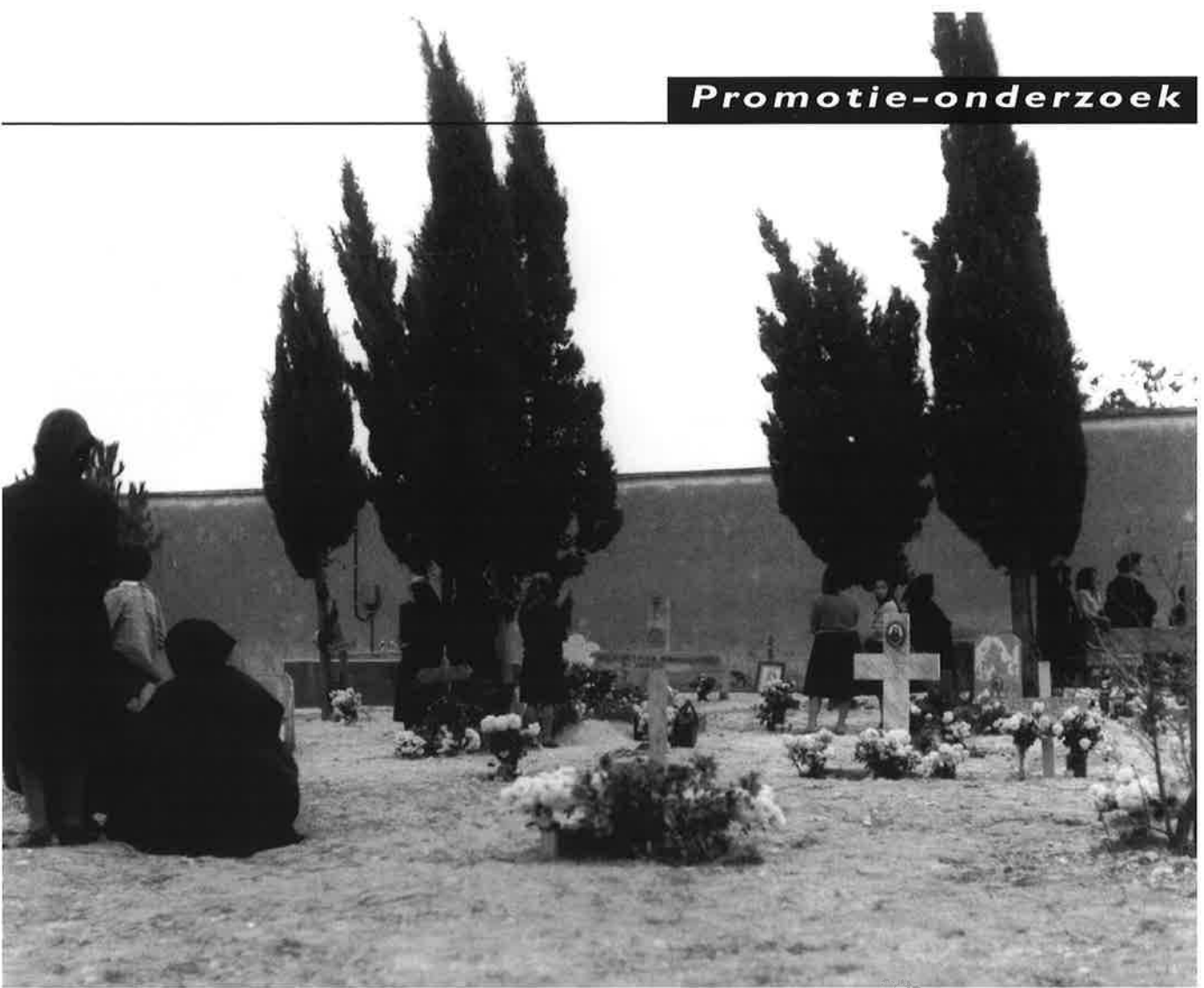
Het kerkhof met Allerzielen in het verleden toen de meeste graven uit eenvoudige grafheuvels bestonden. Op de achtergrond de muur die later een plaats bood als graf voor overleden familieleden van minderbedeelde dorpsbewoners.

moment van de wake is de weduwe in het zwart gekleed zoals de dorps traditie dit voorschrijft: een lange zwarte rok, blouse met lange mouwen, zwarte kousen en ook in huis een zwarte hoofddoek. Als zij na een maand het huis mag verlaten om naar de eerste mis ter nagedachtenis van haar man te gaan, heeft zij een grote zwarte shawl om. Zo zal zij voortaan buitenshuis gekleed gaan. Voor de weduwnaar gelden eveneens strikte rouwvoorschriften, maar de strenge sociale controle geldt hem minder, doordat zijn terrein buitenshuis ligt. De vrouw in de rouw, de weduwe, wordt geacht zich voor de rest van haar leven niet in het sociale leven te begeven, in het bijzonder niet in situaties met een feestelijk karakter. Doordat haar aanwezigheid zo duidelijk in haar huis ligt, is zij veel meer het object van sociale controle, van dorpsroddel, dan de man. "Het weduwschap is een zeer kwetsbare zaak", zei een bejaarde vrouw mij eens, die al meer dan dertig jaar weduwe is. "Vooral in de eerste maanden is de kritiek het grootst. Er werd op alles gelet. Of ik wel steeds correct gekleed ging buitenshuis. Of ik de grote omslagdoek wel genoeg over mijn gezicht hield. Of ik geen aanstoot gaf in mijn gedrag." Het grote aantal aan elkaar verwante families in een vrij gesloten dorps samenleving was mede oorzaak voor het lange behoud van deze zeer rigide rouwregels.