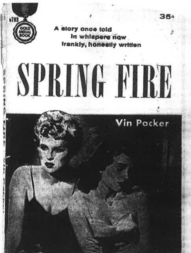
Voorkant van een Amerikaans pulpboekje

In De Litteraire salon heeft Parijs een grotere functie omdat zich daar de kunstenaarswereld bevindt waar de hoofdpersoon haar lesbische aard ontdekt.